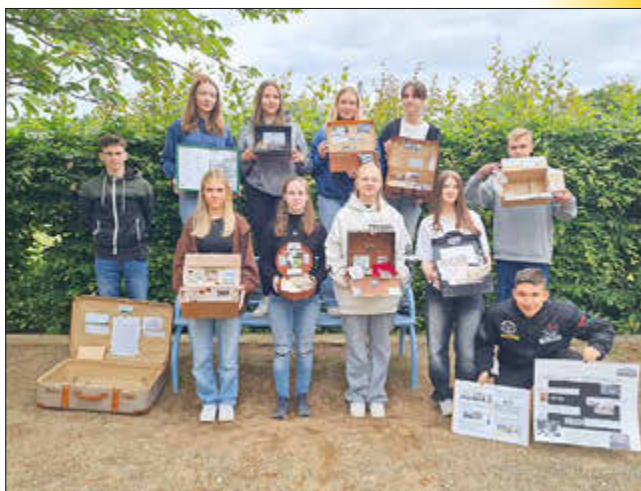
Die Schülerinnen und Schüler präsentieren ihre Projektaufträge nach dem Schulausflug