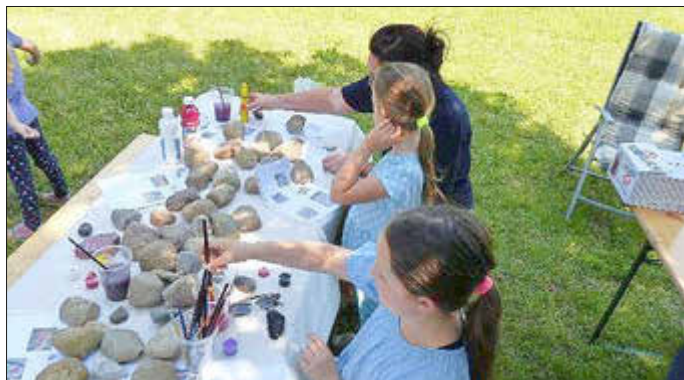
Flohmarkt und Maltisch