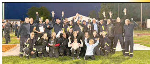
Die glückliche Mirower Siegermannschaft inmitten ihrer Banzkower Kameradinnen und -kameraden.