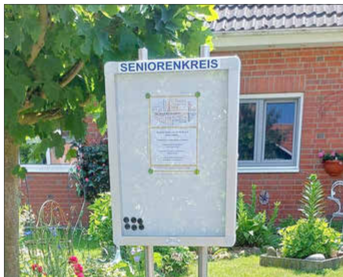
Schaukasten am Soll in Retgendorf

Der Seniorenkreis Dobin am See hält die regelmäßige Information der Senioren für sehr wichtig. Wir nutzen bereits jetzt verschiedene Medien. Der Amtsbote, E-Mails, nebenan.de und unsere Schaukästen werden stets aktuell bestückt.