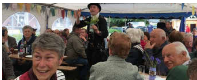
Der geigende Schornsteinfeger

Der Seniorenstammtisch hat vor der Sommerpause gemeinsam mit den Bewohnern des Hauses Jona der Diakonie sein jährliches Sommerfest veranstaltet. Höhepunkt war unbestritten der Auftritt des geigenden Schornsteinfegers, der für seine Lieder und Zauberkunststücke viel Beifall erhielt.