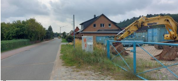
Östliche Plangebietsgrenze – Conrader Straße Richtung Süden.