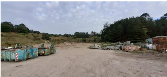
Nördliche Plangebietsgrenze mit gewerblicher Nutzung und dem angrenzenden Wald.

Die angrenzenden Planbereiche werden durch die Bebauungs- und Grünstrukturen der Ortslage Consrade geprägt. Im Süden befindet sich das Wohngebiet an der Straße „Am Hang“ und im Osten die ältere, gewachsene Bebauung des Ortes. Vorherrschender Gebäudetyp ist das freistehende, eingeschossige Einfamilienhaus.