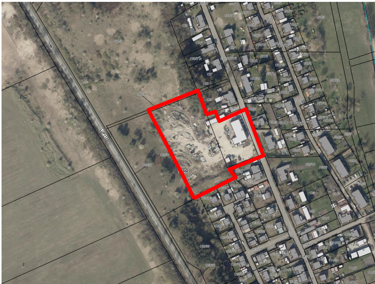
Abb. 2: Luftbild mit Geltungsbereich des Bebauungsplanes Nr. 24; Luftbild © GeoBasis-DE/MV 2022.

Im Norden wurde ein Teil des schmalen Flurstücks 180/4, Flur 1, Gemarkung Conrade, mit einbezogen. Aber auch hier folgt die Abgrenzung, mit Ausnahme der Waldfläche, im Wesentlichen dem ehemaligen Betriebsgelände.