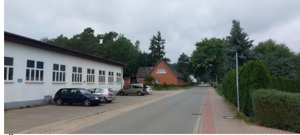
Östliche Plangebietsgrenze – Conrader Straße Richtung Norden.