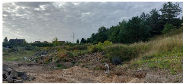
Südliche Plangebietsgrenze mit der vorhandenen Wohnbebauung und dem angrenzenden Wald.